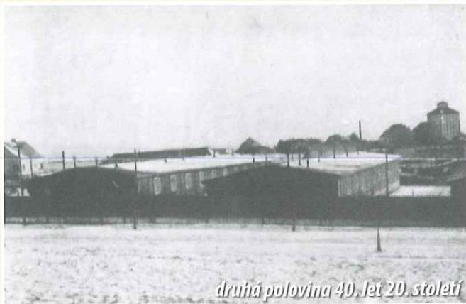
druhá polovina 40. let 20. století